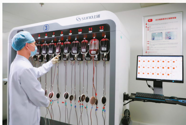
工作人员在开展去白细胞红细胞悬液的制备。