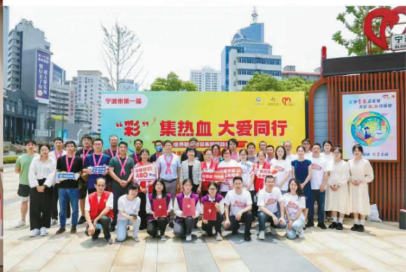
宁波市打造多元宣传矩阵,扩大无偿献血影响力。

今年是《浙江省实施〈中华人民共和国献血法〉办法》修订施行十周年。十年来,我市无偿献血事业持续巩固“政府主导、部门协作、社会参与”的工作模式,得到持续健康发展。2013—2022年,全市献血人次和献血量逐年递增,献血总人次从2013年的7.6万提升到2022年的10.8万,增长42.1%;捐献全血总量从2013年的21091.3升提升到2022年的31832.0升,增长50.9%;机采血小