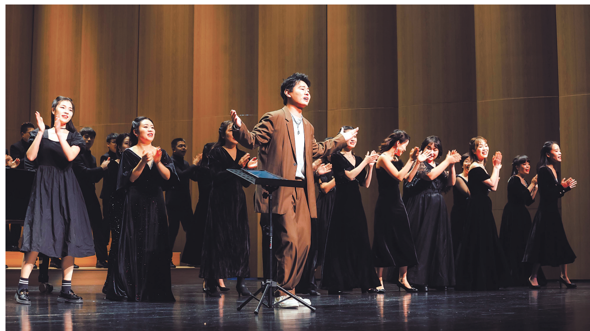
▶鄞州星光合唱团演出场景。

鄞州星光合唱团现有团员60余名,由音乐教师及来自社会各界的音乐爱好者组成。自2013年成立以来,鄞州星光合唱团先后获得中国合唱节金奖和国际合唱大赛最高奖等多项荣誉。