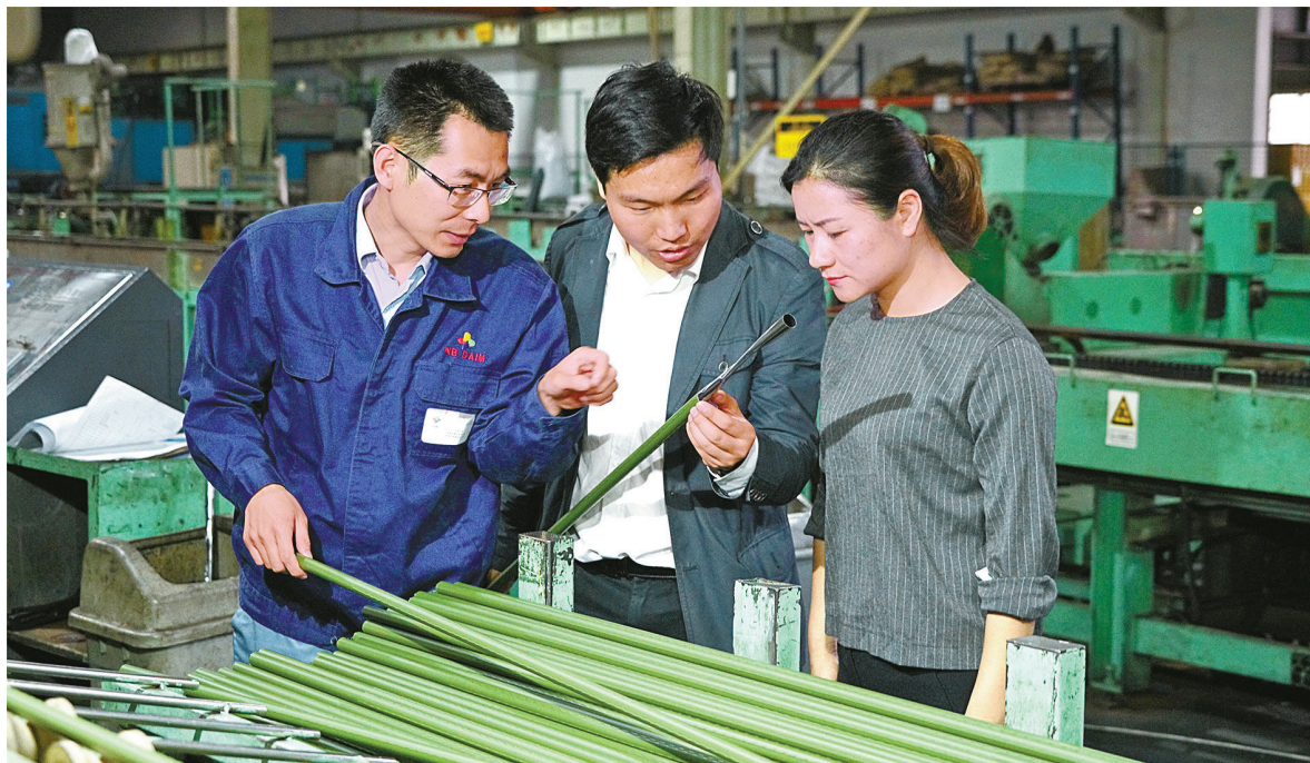
建行宁波市分行客户服务团队深入企业生产现场了解情况。

名班子成员聚焦7个调研课题,到50余家内外部单位开展主题教育专题调研,共计梳理出25条具体问题,并整理任务清单,明确责任部门。中国银行宁波市分行党委安排为期7天的读书班,共安排10个学习专题、分两个阶段组织封闭式集中学习。上海银行宁波分行作为上海银行跨区域经营的首家分行、同时也是中国城市商业银行跨区域经营的第一家分行,举行多层次形式的主题教育,深入实施“精品银行”战略,沿着“线上化、数字化、智能化”数字化转型实施路径,为宁波建设现代化滨海大都市、唱好“双城记”、建设共同富裕先行市贡献力量。中信银行宁波分行通过主题教育,深化对“千万工程”精神和内涵的思想认识,领悟金融助力乡村振兴的深刻内涵,深度参与宁波市“4566”乡村产业振兴行动和“13511”美丽乡村建设工程,推动中信“甬惠助农贷”产品融入田间地头,共同绘就宁波绿水青山美丽画卷。今年6月,甬城农商银行赴福建古田,学习贯彻习近平新时代中国特色社会主义思想主题教育精神,开展沉浸式思想溯源,在循迹学、体验学中不断增强对党的创新理论的思想认同、政治认同和情感认同,统一思想,坚定了自身在乡村振兴中的任务和使命。