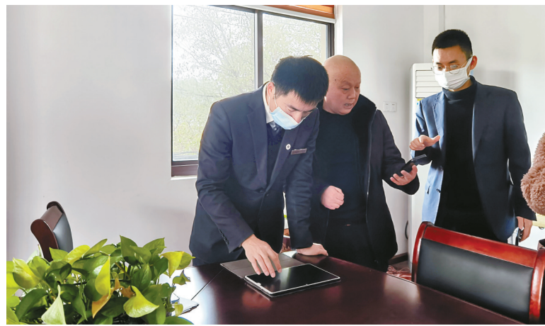
宁波通商银行客户经理协同运营人员走访重点园区内企业。

产品“创新化”，让服务效果更显著。秉持“单个发现、充分调研、精准开发”三大原则，重点打造以经销商数据贷、订单融资、买方信贷为核心的供应链产品体系。如对饲料经销商供应链推出经销商数据贷和预付保证金贷款业务，企业仅需提供可证明贸易真实性的背景材料即可申请贷款。合作以来，累计服务饲料经销商及养殖户近400户，发放授信支持3.43余亿元。