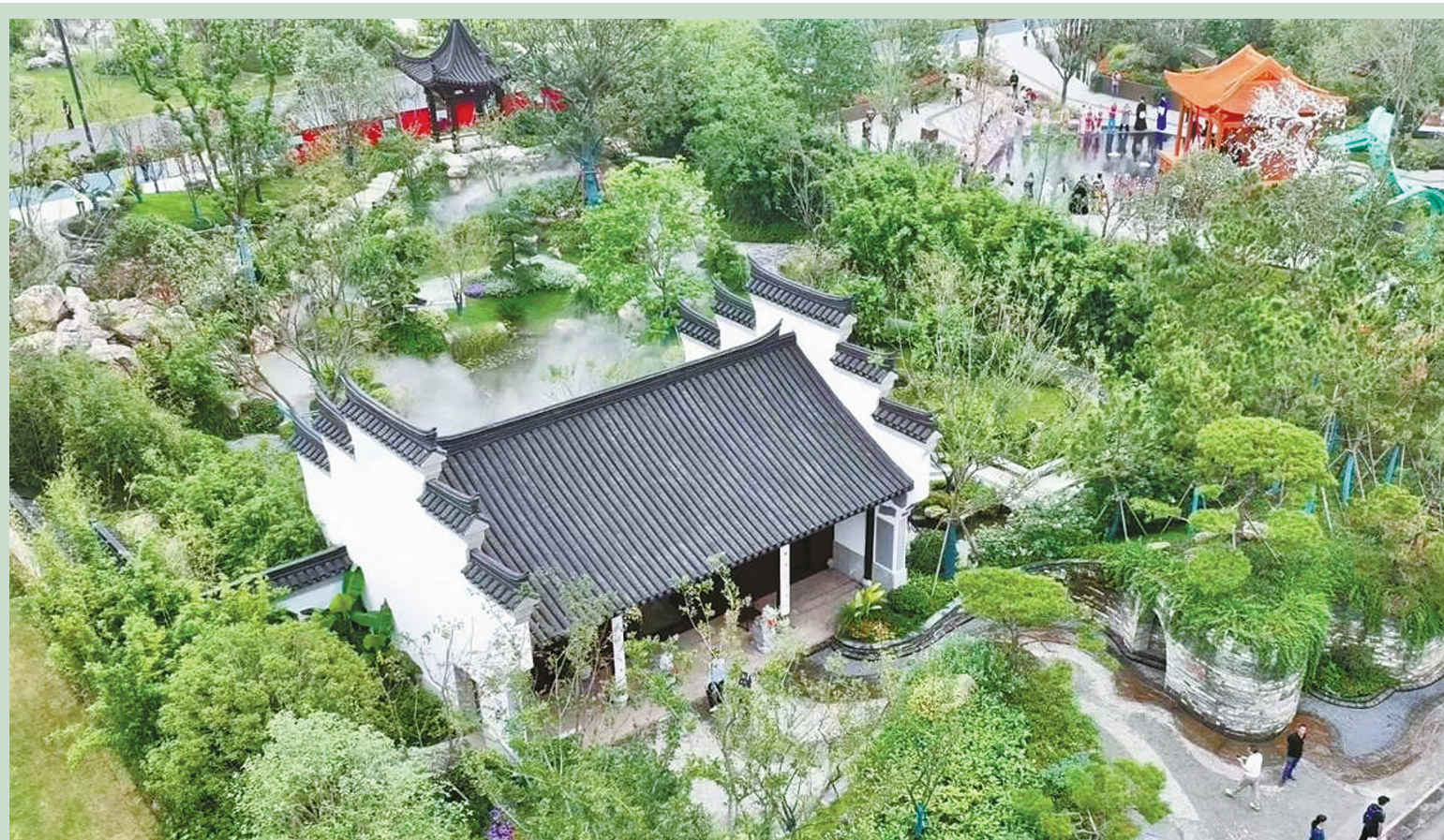
“宁波园”城市展园俯瞰图。