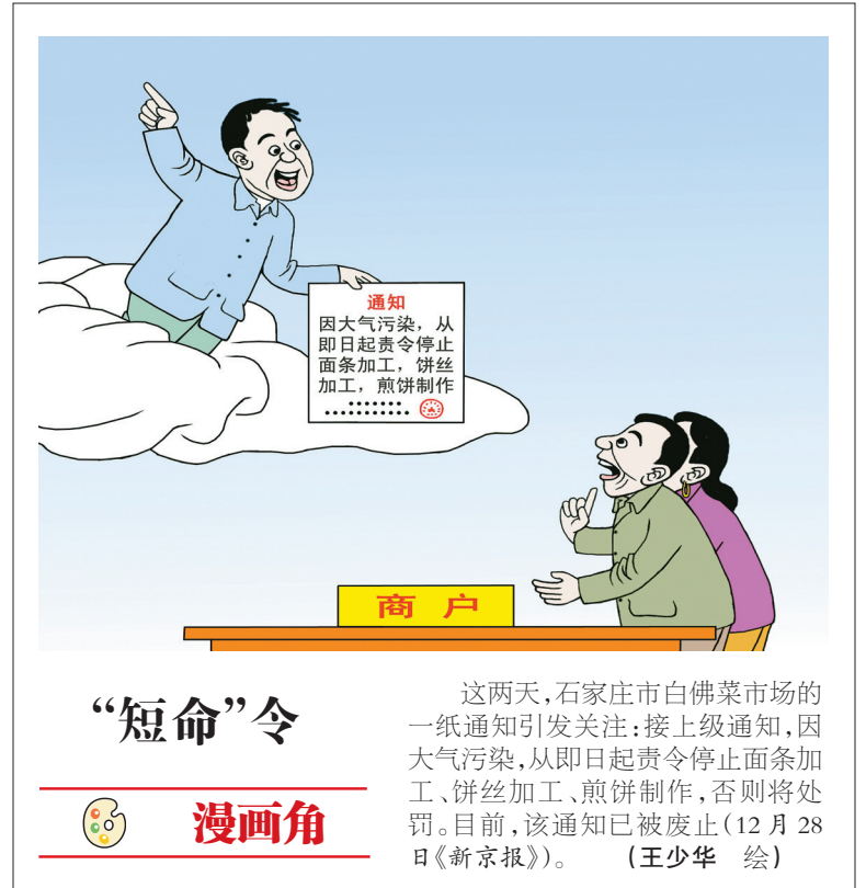
这两天,石家庄市白佛菜市场的“短命”令一纸通知引发关注:接上级通知,因大气污染,从即日起责令停止面食加工、饼丝加工、煎饼制作,否则将处罚。目前,该通知已被废止(12月28日《新京报》)。(王少华 绘)

医生是否可以强行留下并抢救患者,既是一个医学技术问题,也是一个法律问题,有时还涉及生命伦理等其他问题。这位医生强留患者抢救因最终效果很好而成为美谈,但不妨设想,假如这位医生判断失误,或因抢救过程中出现差错导致患者死亡,或许就会变成很难定性的医疗纠纷。这起典型病例及相关医学与法律问题,值得医学界和法律界思考。唯有未雨绸缪为这类问题找到答案,才能更好地维护医疗秩序和医患关系。