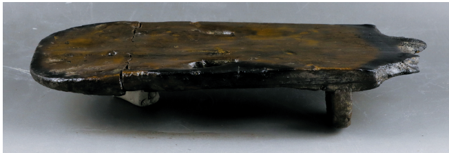
树桥遗址出土的木屐。