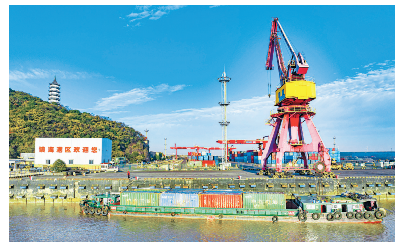
杭甬运河上的集装箱船。