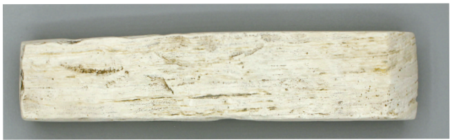
潘家套遗址出土的钱山漾文化时期的石铈。