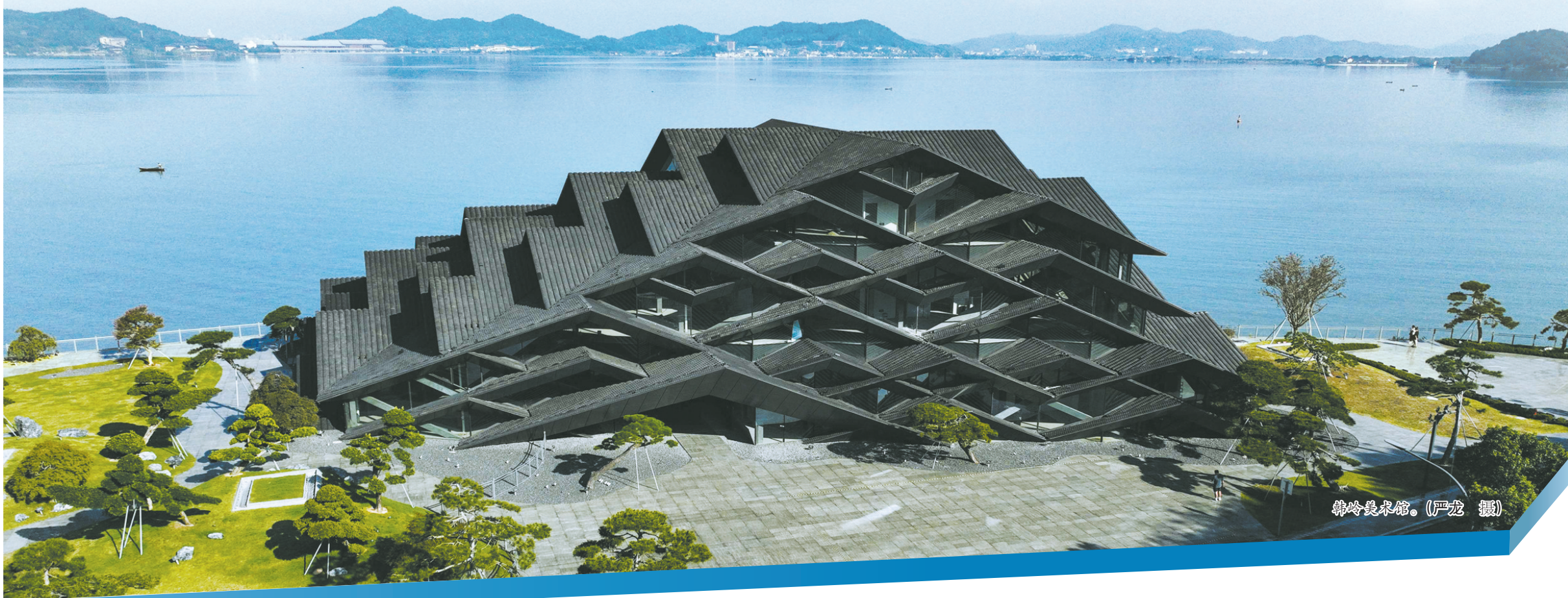
韩岭美术馆。