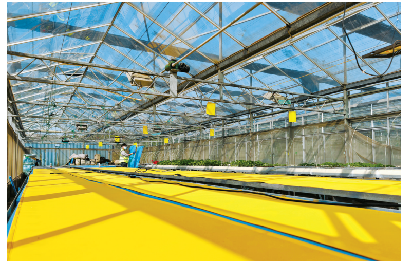
育苗床上的石墨烯电热膜。

据悉，从2021年底开始，国家石墨烯创新中心与宁波市农科院联手打造石墨烯远红外育苗应用示范基地。