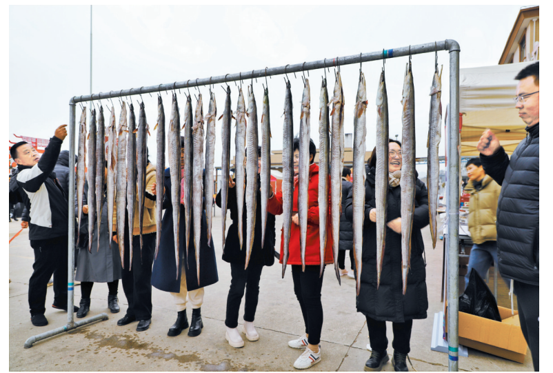
集市上的风鳗。

“今天生意很好，我们都忙不过来，两个小时就卖出了5000多元的海货。”在家门口摆摊的村民老薛笑容满面。