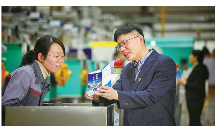
北仑区纪检监察干部向企业员工讲解相关政策。

2023年以来，北仑区纪委监委不断强化以党风政风监督室牵头、“室组地”联动的“烦恼指数”监督专班统筹工作，创新推动“线上+线下”“双督”机制，街道纪工委每月及时跟进涉企问题解决情况，督促街道相关部门及时反馈、落实，将监督“嵌入”日常；对于需要区级职