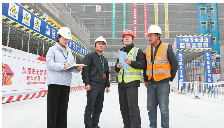
海曙区纪委监委深入一线、靠前监督，确保工程项目在阳光下推进。