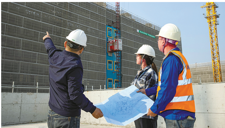
海曙区纪委监委创新探索“一件事”问责预警机制，并将其运用到重大项目建设领域，督促推动相关责任单位“照单体检”、对标履责、防患未然，助力重大项目跑出“加速度”。图为该区纪检干部深入海曙中学项目现场了解项目推进情况。

“模拟问责，提前明确可能出现的情形，以及对应的责任和问责，让不少单位心生敬畏，从原来‘等着看’到现在的‘领着办’转变非常明显。”海曙区纪委监委相关负责人说。