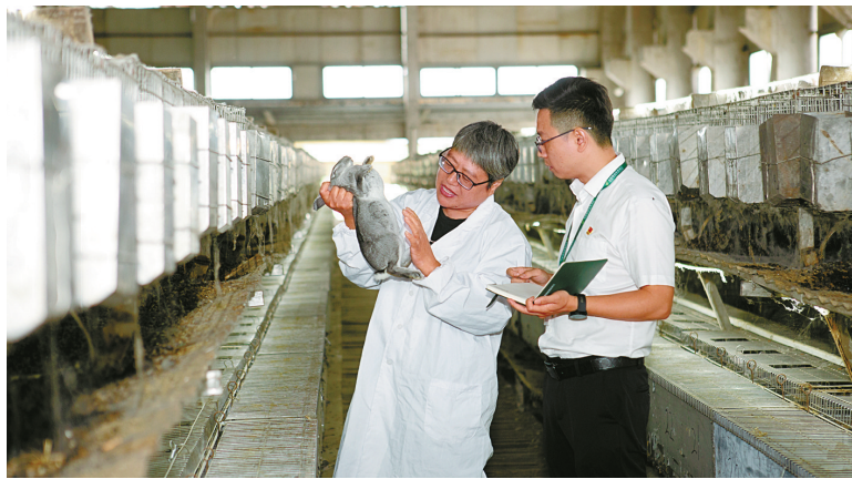
邮储银行工作人员走进企业调研。

持续深化政金企合作，切实推动“科技+产业+金融”良性循环，坚持改革创新，推动建立科创金融服务新模式。