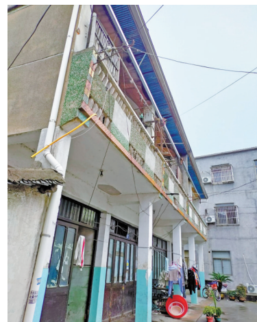
强村路168号房屋外飞线密集。