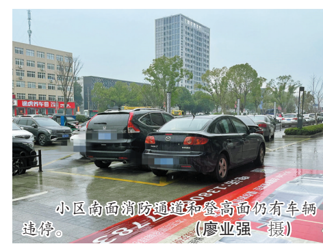
小区南面消防通道和登高面仍有车辆违停。