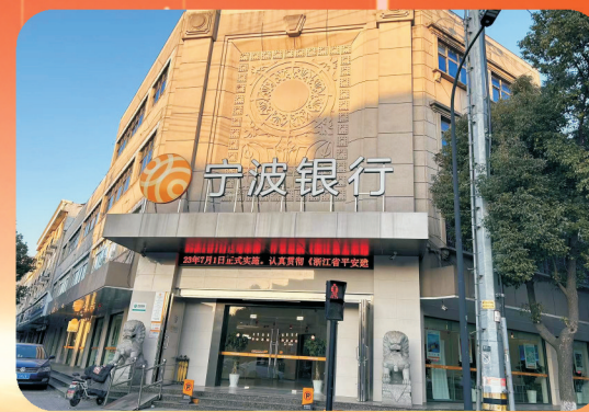
宁波银行周巷支行 慈溪市周巷镇开发大道418号