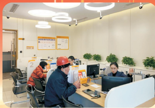
宁波银行徐家漕社区支行 宁波市海曙区庙洪路516号