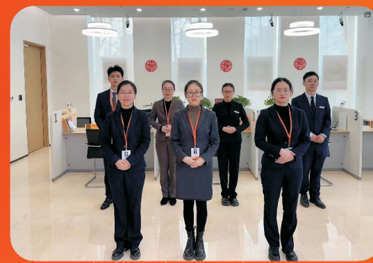
宁波银行慈溪中心区支行 慈溪市新城大道北路1600号