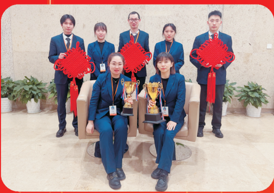
宁波银行鄞州中心区支行 宁波市鄞州区宁南南路700号