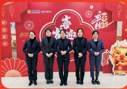
宁波银行余姚中心区支行 余姚市阳明街道玉立路136号