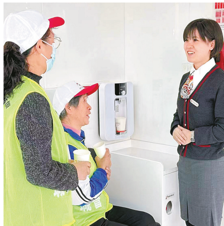
城管义工在浙商银行爱心驿站内休息。

未来,浙商银行宁波江东支行将秉承“以客户为中心”的服务理念,致力于提供全方位的金融服务,以人性化的服务流程和专业的服务团队,帮助客户实现财富增值和生活品质提升。