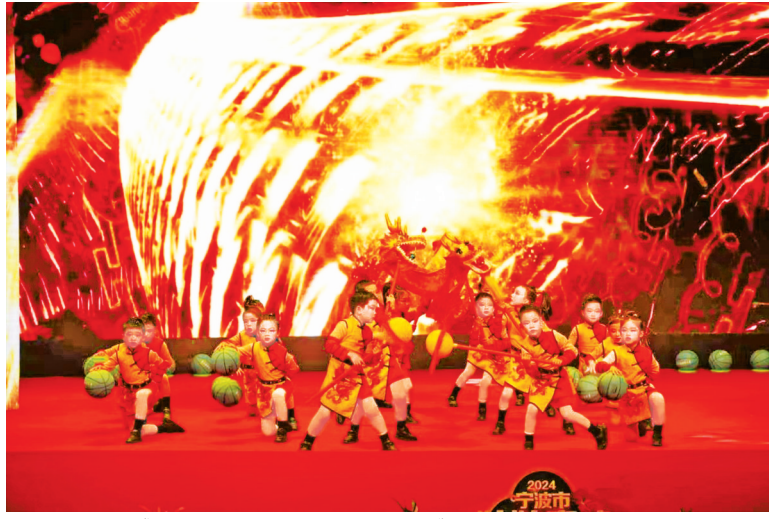
篮球操《龙的传人·这条街最靓的仔》节目。

此外，4岁登台、曾获得宁波市第五届少儿曲艺大赛银奖的10岁小朋友屠诗婕，带来了她的拿手