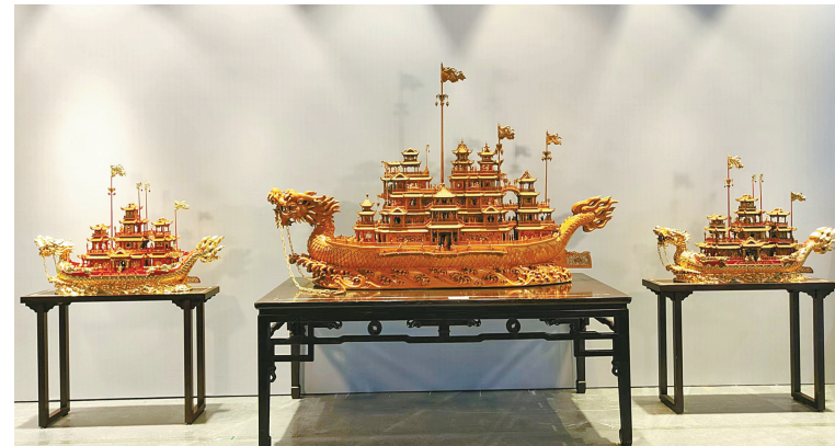
2023年入围中国民间文艺山花奖终评的《海上丝路：中华龙舟系列》。