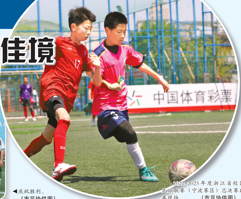
2022~2023年度浙江省校园足球联赛（宁波赛区）总决赛比赛现场。