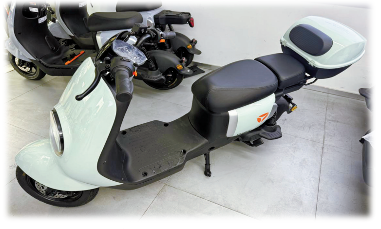
增加电池、加长座椅后的电动自行车。

“我们有专业人士可以提速，车辆时速可达五六十公里，但仪表盘仍显示25公里。即使被交警拦住了，看到车辆有正式牌照，要进一步查证和处罚也很麻烦。”她说。