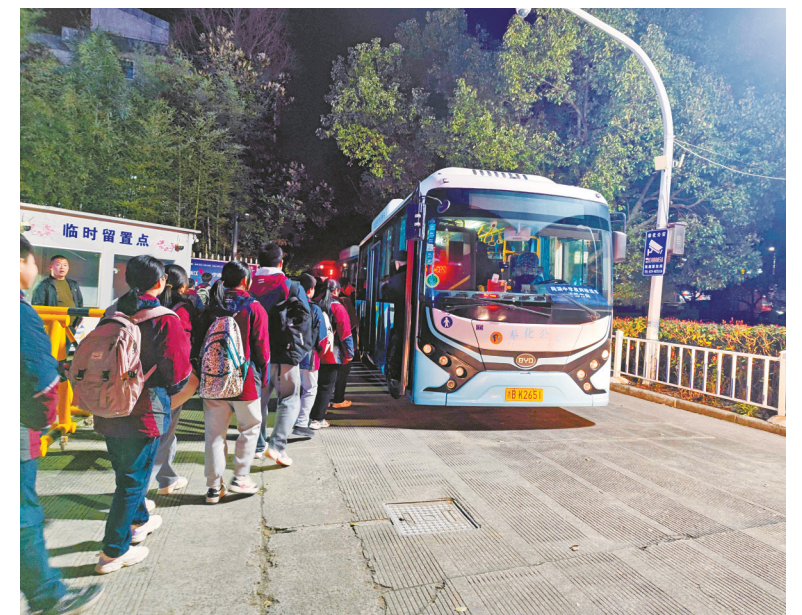
学生在有序上车。

目前，莼湖中学夜间接送公交专线开设4条线路，设置了近40个站点，运行公交车5辆，其中下陈、楼隘、白杜方向各1辆，桐照方向2辆，共有181名学生报名乘坐。通过此项措施，既切实保障了学生安全、精准回家，又缓解了莼湖中学放学时的交通拥堵现象和家长的接送压力。