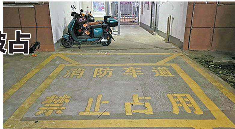
鄞州区东兴小区的消防通道被占用。

半的居民是租客。他们没有购买车位，所以只能停在小区地面的临时车位上。“下班后没抢到车位的居民很可能会停在消防通道上。遇到这种情况，我们只能打电话给车主，让他们来挪车。”