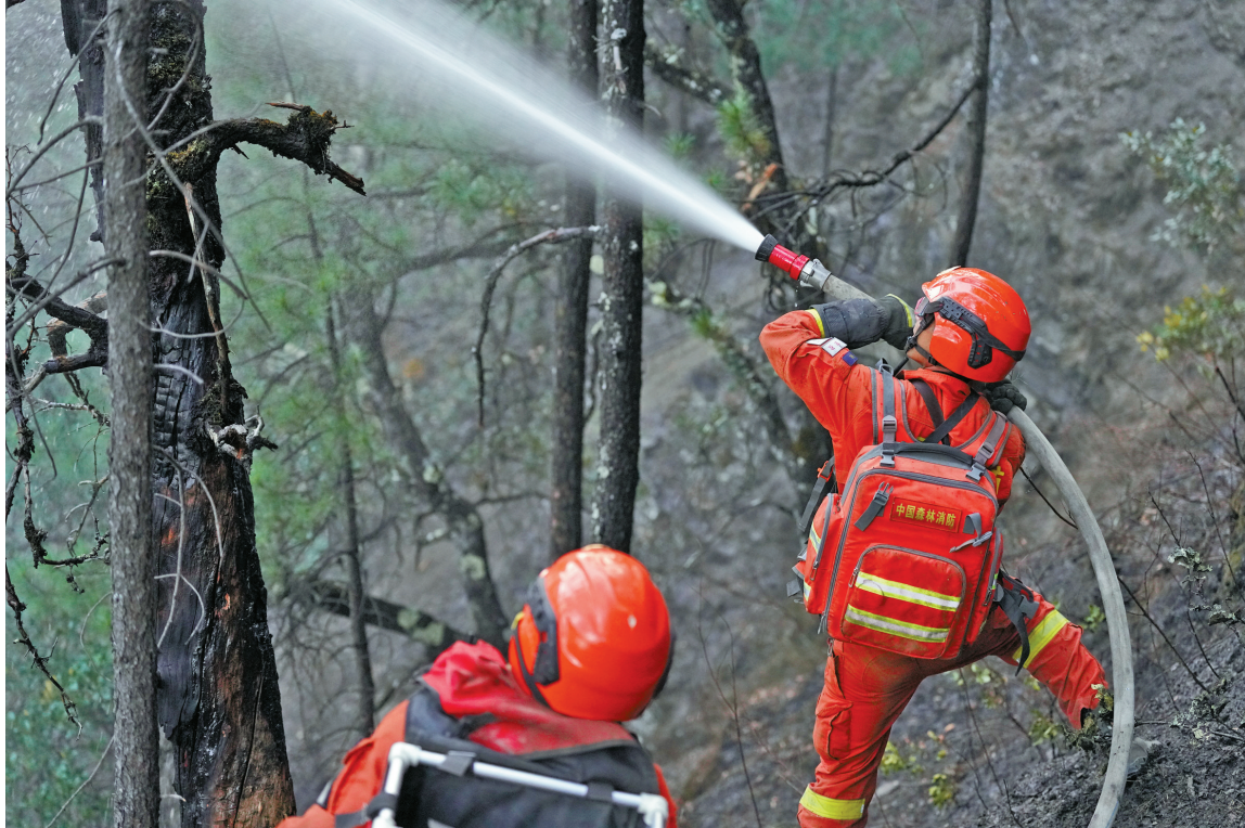
3月17日,消防救援力量抵达火灾现场,展开扑救。

3月15日17时,雅江县呷拉镇白孜村发生一起森林火灾。后因火场风力突然增大,火势迅速扩大蔓延成由南向北3个火场。