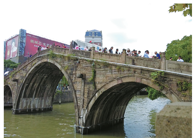
“跟着微短剧去旅行·情系河姆渡”剧情游线路中的通济桥。

作者赓续接力的传奇故事。其中微短剧《河姆渡的骨哨声》用现代考古队员小季和远古的河姆渡姑娘“柳”之间的邂逅,讲述河姆渡遗址的发现故事,全网播放量接近1600万。 “余姚拥有丰富的文旅资源,是镶嵌在浙东唐诗之路上的璀璨明珠。跟普通打卡游览线路不同,这次我们用剧情的‘线’,串起了文旅的‘点’。”余姚市文化和广电旅游体育局有关负责人说,“早在10年前,我们就着手以微短剧促进文旅融合发展,剧情游线路的发布,正是余姚‘十年磨一剑’结出的果实。” 下一步,余姚将依托深厚的人文历史底蕴,通过微短剧这一生动的表现形式,吸引更多文化走进余姚、了解余姚、感受余姚,将微短剧打造成余姚新的文化名片。