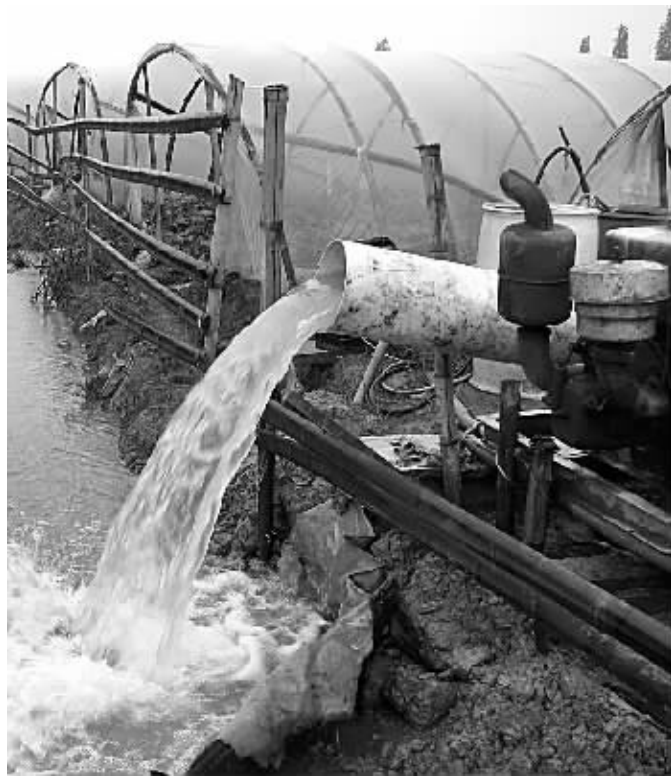
图为受淹的大棚西瓜地正在排涝。

余姚全市共有地质灾害点117处,经过近年来的搬迁治理,67处已稳定,针对另50处可能发生泥石流、山体滑坡、山洪等次生灾害的地质灾害点,连日来,该市加强监测和防范,提高巡查频率,落实各项预警措施,并及时撤离79户、286名灾害威胁区域内的人员。