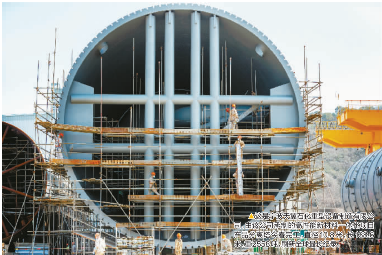
▲这是宁波天翼石化重型设备制造有限公司,由该公司承制的高性能新材料一体化项目产品分离塔今春完工,直径10.8米,长138.6米,重2558吨,刷新全球最长纪录。

象山摄影师纪申浦在过去一年里,采访拍摄了象山数十家企业的数字化车间和智能装备,定格这片“智造蓝海”创新驱动、数字赋能、整合集成、绿色发展的种种努力。