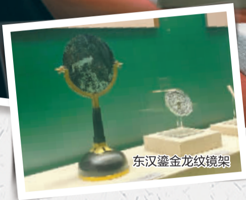
东汉鎏金龙纹镜架