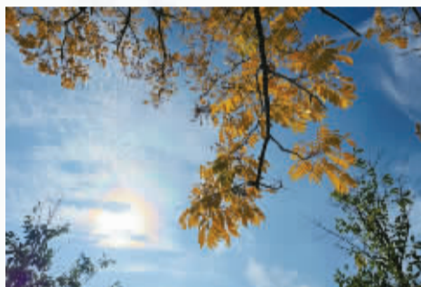
一岁一枯荣的笃定，来自风霜的锤炼，还是阳光的承诺？向着光，踏着地，用等待磨炼心志，用成长消解困顿，力量便由此而生。