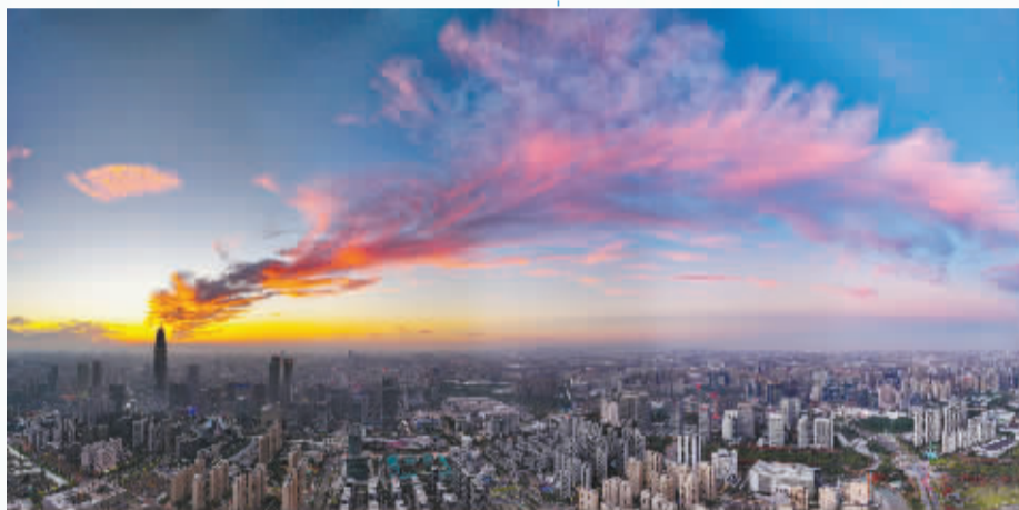
冬天的清冷躯壳下，一定有颗火热的心。风雪冰霜都灭不了心里的那团火，一次起心动念，便有万物吐纳，大笔挥就，一气呵成。