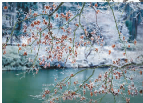
终于等来这场初雪，雪是冬天的伴手礼，凝结了水的思念，风的留言。她不动声色地让世界安静，然后定格成一张你最想发给那个谁的照片。