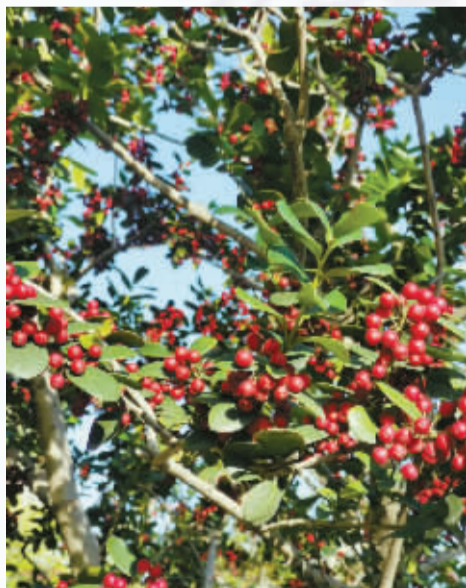
冬天，有叶落归根，也有花开果成。那么隆重、红火、俊俏的果，让你在最冷的风里，收获最大的暖意。她们不说话，却知心。