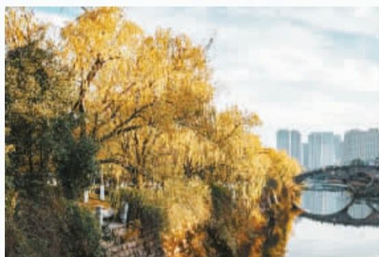
庭前垂柳，珍重待春风。九九消寒，就是看一枝柳从叶落枝枯到碧玉妆成，看静止中的萌动，枯萎中的新生，轮回中的永恒。到了日子，自有二月春风似剪刀，剪出我喜欢的样子。所以，我愿意等。 薛宏_GWfv 摄