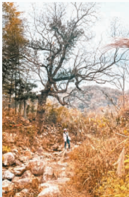
在冷风里去看溪涧一株古树，她很老很老，她的果子很小很小，因为只有足够轻盈，才可以顺着风，去更大的天地。植物迎接春天的方式是从头来过，那么我们呢？