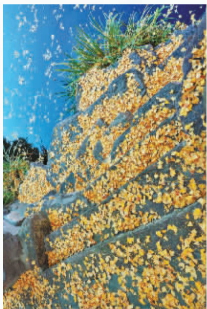
曾经那么耀眼，陨落也不过一瞬间。树越高，越放得下，她知道只有舍得，才能获得，不执着于拥有，才可能长久。

所以冬至是个值得庆祝的日子，她是时光流转中的留白，褪去缤纷色彩，清空千言万语，一笔一画，从头开始。