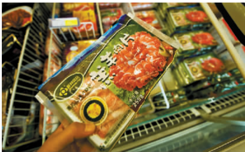
昨晚,市区一家超市内,羊肉卷仍在正常销售。

公安部日前公布一起食品安全犯罪案件显示,有江苏不法商家将未经检验的狐狸、水貂等肉品掺入羊肉中制售假羊肉,并销往江苏、上海等地。假羊肉事件曝光以来,各方反应不同。据记者昨天采访获悉,目前我市工商等部门尚未对羊肉市场展开检查,部分超市羊肉制品仍在正常销售。但我市的火锅店等餐饮机构内,羊肉卷已迅速被打入“冷宫”。