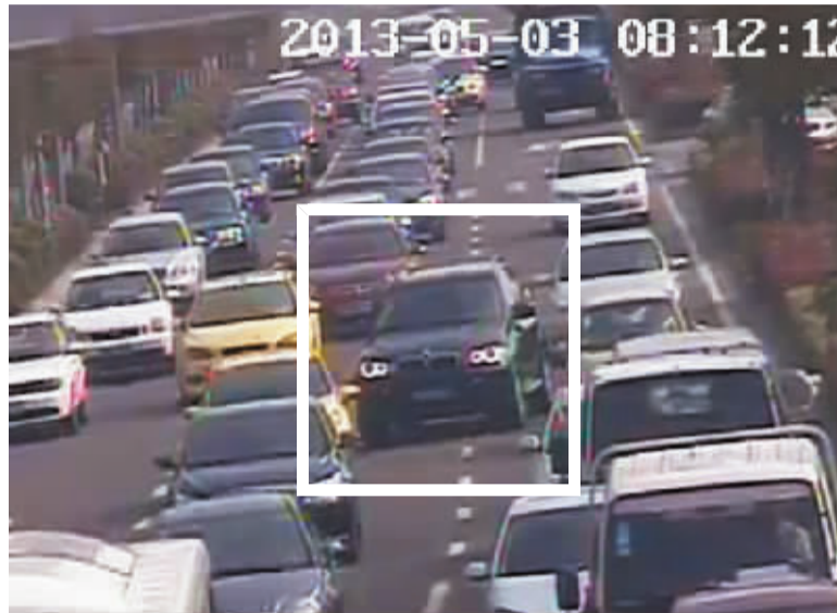
图中加框处为黑色吉普强行越白虚线加塞。