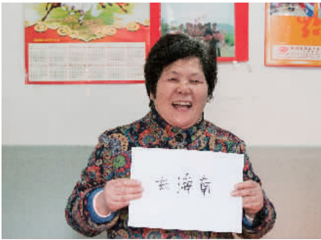
楼小多的新年梦想