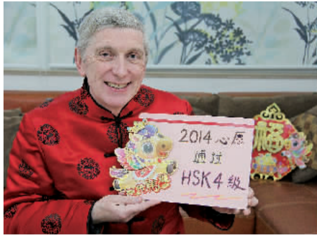
达尔文的新年梦想