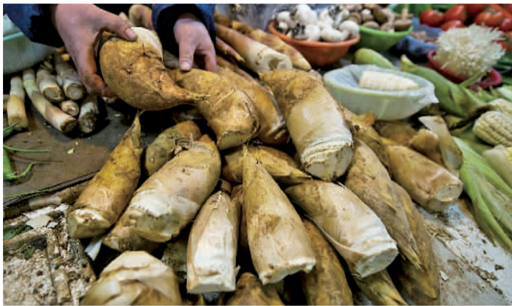
江东一菜市场里销售的冬笋。