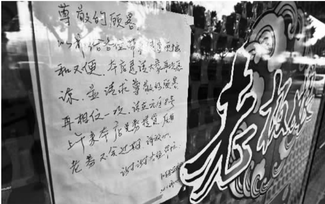
老板娘食品百丈路店提货日期一改再改，引起大量投诉。

据市政府金融办人士表示，继小贷公司综合利率指数后，我市还将把全市民间借贷登记中心、民间资本管理公司、典当行、担保公司等利率指数逐步纳入，以形成宁波民间借贷综合利率指数。