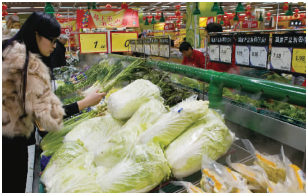
近期外地叶类菜源源不断流入甬城，总量供大于求。