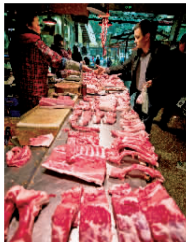
春节临近，猪肉销量较好。

去年宁波人对于家禽和禽蛋的消费力有所减弱。统计显示，去年宁波人共消费家禽3163万只，禽蛋2.3万吨。其中，家禽的消费量比2012年下滑了37.4%，禽蛋的消费量与2012年基本持平。