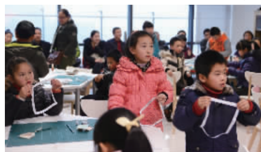
科学EDU科普培训课程