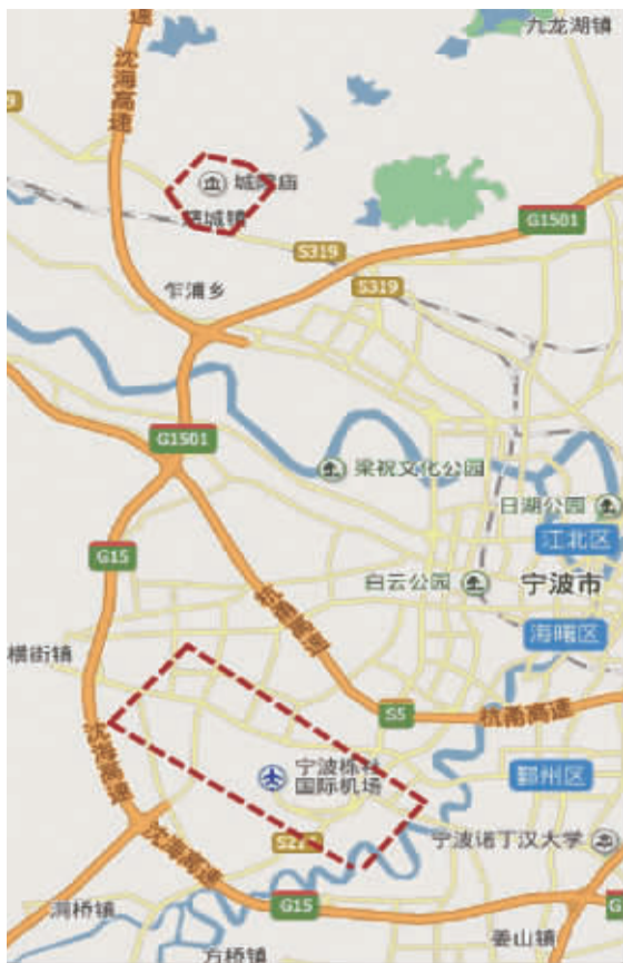
宁波市中心城区禁止烟花爆竹经营燃放区域示意图(图内红色虚线区域)。