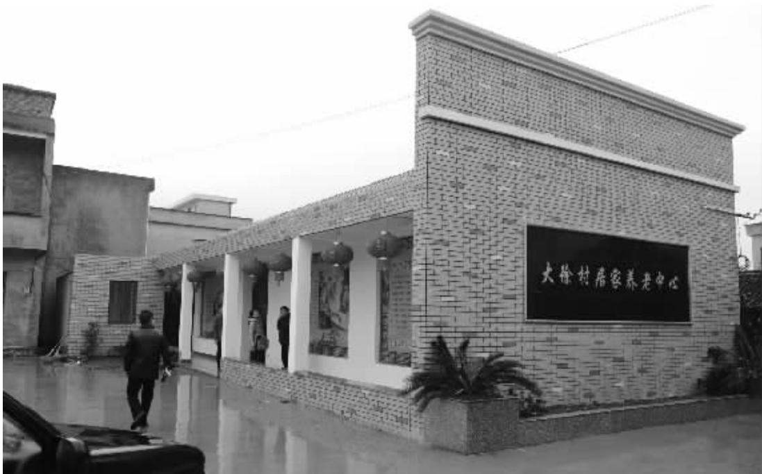
由徐祥青拖着病体募得善款修建的“大徐村居家养老中心”即将开张。