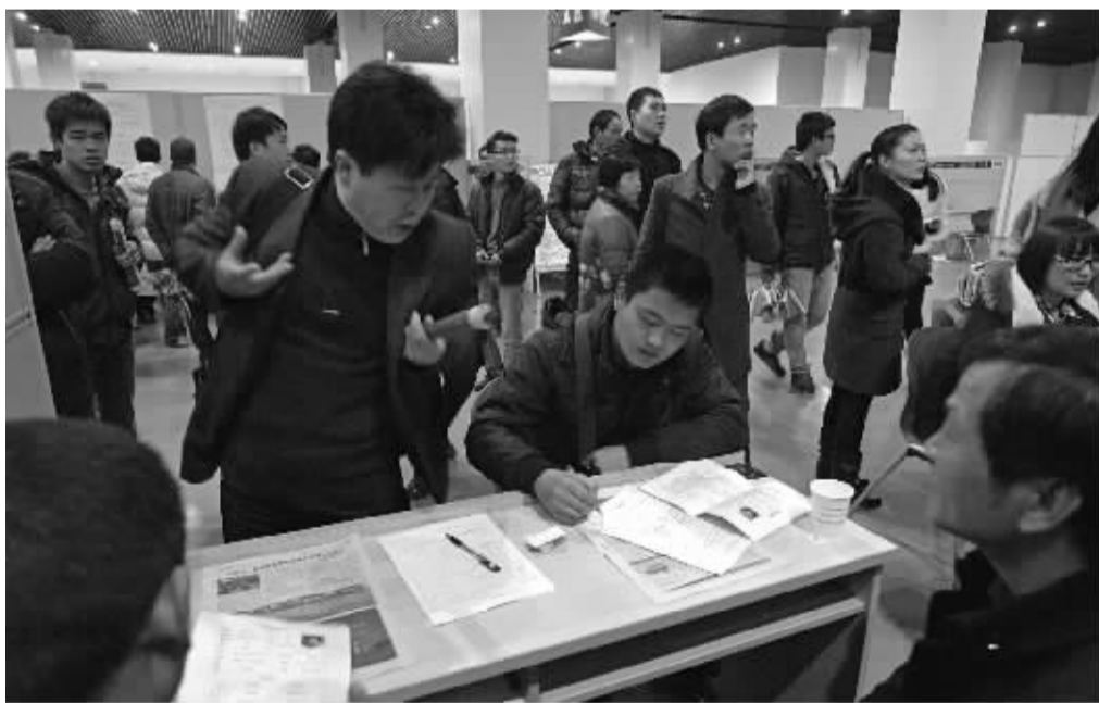
昨天，宁波市人力资源市场举办马年首场技能（劳务）人才专场招聘会。

在招聘会现场，很多外来务工人员初五、初六就回到了宁波，为的是赶上这第一场招聘会。相比往年，今年多家劳动密集型企业对普工需求有所减少，而有门手艺的技术人才更吃香了，企业开出薪资待遇也很不错。