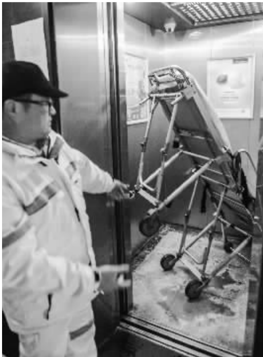
很多高层住宅电梯都容不下担架。