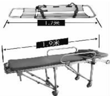
救护车配备的担架