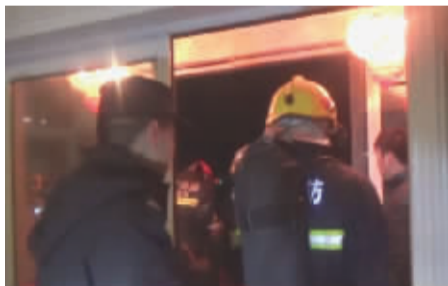
这两个灯笼被看成了“火光”。