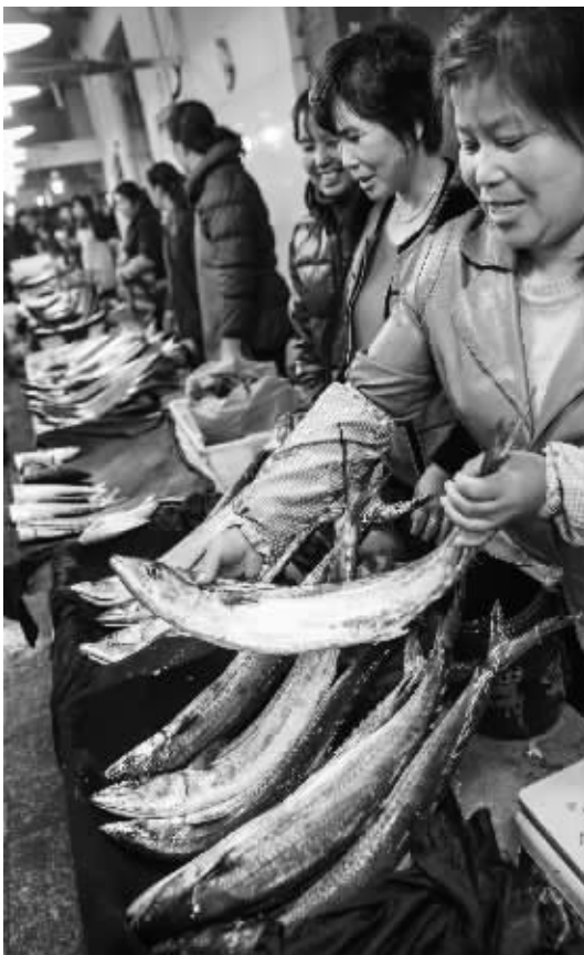
昨天早上，咸祥菜场里，水产经营户售卖马鲛鱼。

目前，我市已着手制订并实施马鲛鱼资源管理规定，并将建立有效的保护区管理体系，实时监测跟踪保护区内的马鲛鱼资源变动情况。根据计划，我市将通过增殖放流