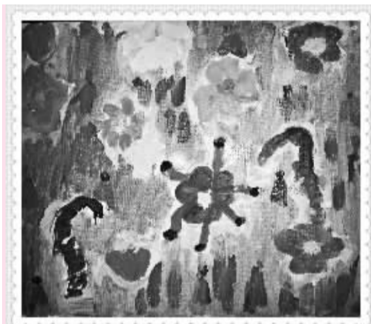
《春花烂漫》 东城201班 陆美似 (证号31045)