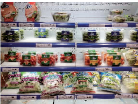
市区一家超市里，有不少打着有机标签的产品。

最简单的办法就是识别有机防伪追溯标签上的17位数字，并且要求在17位数字前加“有机码”。市民可以登录国家认监委官方网站中的“中国食品农产品认证信息系统”查询每一张有机认证证书的相关信息，证书信息中标示了认证机构、证书编号、获证企业、认证证书类型、认证产品名称、生产基地名称和地址、认证年产量等。