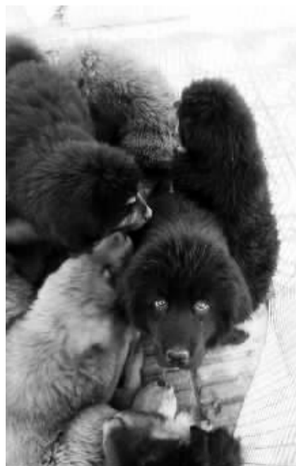
高速公路边叫卖的藏獒。

记者随后将这一情况向96310城管热线进行了反映。他们表示将立即派城管执法人员前往现场查看，并对养獒人占用人行道销售犬只的行为依法进行管理。