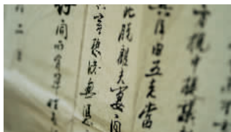
相当于现在的离婚协议的离异据。