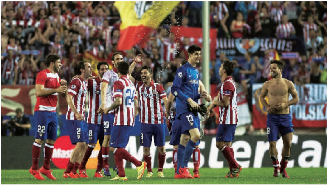
马竞淘汰巴萨后，队员庆祝胜利。