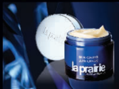
SKIN CAVIAR LUXE CREAM 鱼子精华琼贵面霜