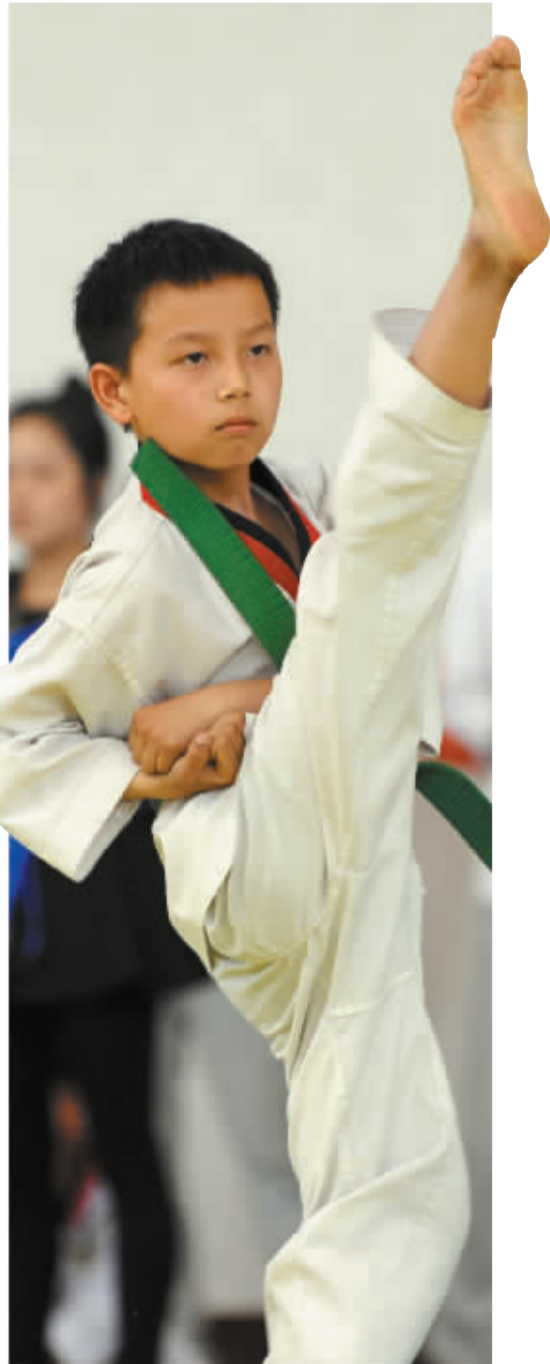
这几年，我市选手的跆拳道水平在不断地提高。图为比赛现场。

据悉，第九届浙江省大众跆拳道公开赛宁波分区赛由浙江省体育总会和浙江省跆拳道协会主办，宁波市跆拳道协会、宁波市跆拳道俱乐部联盟等单位协办，为我市规格最高、水平最高的唯一一项面向大众的跆拳道官方竞赛平台。宁波分区赛是所有分区赛中的第一场，共吸引28支队伍，600多位参赛人员共同角逐个人竞技比赛、个人品势、团体品势、混双品势、跆拳道舞等五个常规项目的金牌。每个项目下每一组别的第一名将代表宁波参加11月在杭州举行的省总决赛。