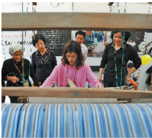
市民在体验余姚土布制作。