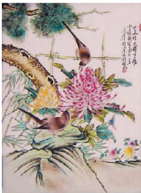
“珠山八友”的花鸟瓷板画