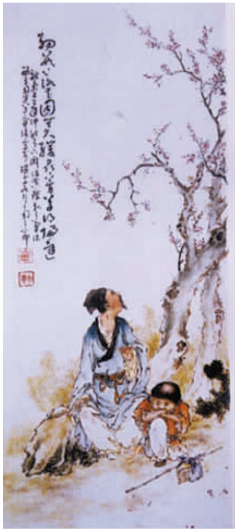
“珠山八友”的《静观落花图》瓷板画