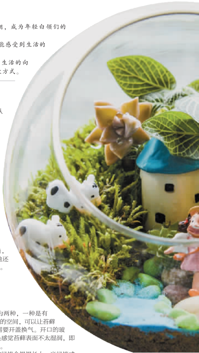
白领案头的微盆景。

最后，随着时间的推移，微盆景中的绿植会慢慢长大，当绿植成长到与微盆景不成比例时，就需要更换了。