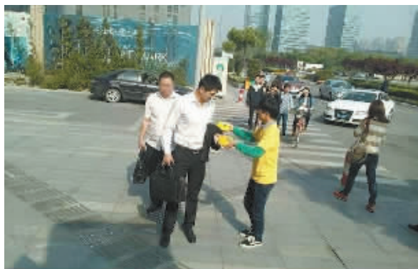
信达中建:造房子,更是“造”生活

忙碌的城市,忙碌的你,每天上班和下班。努力证明自己,却忽略了健康问题。少吃一顿早餐,就多一天伤胃伤肝,家人就多一份伤心伤感。在健康面前,其他一切都是浮云。