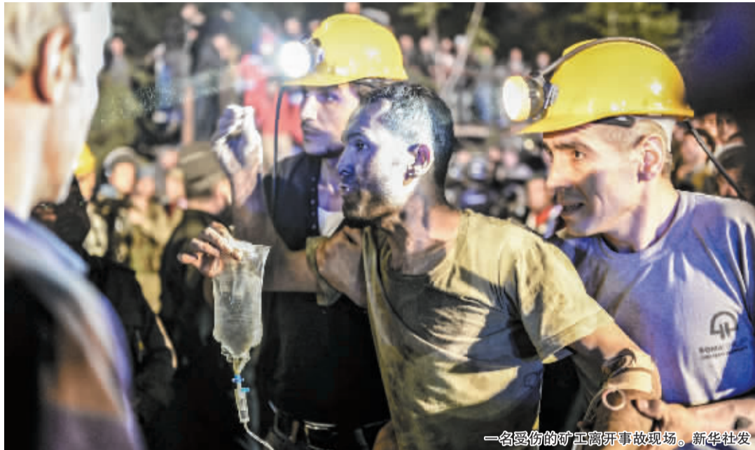
一名受伤的矿工离开事故现场。

土耳其西部一座煤矿13日发生爆炸起火事件，土耳其能源和自然资源部长塔内尔·耶尔德兹14日说，已有238名矿工遇难。土耳其灾害管理机构说，已经救出93人，其中87人受伤，可能还有120人受困。媒体早些时候报道说，事故发生时共有787名矿工在井下作业。