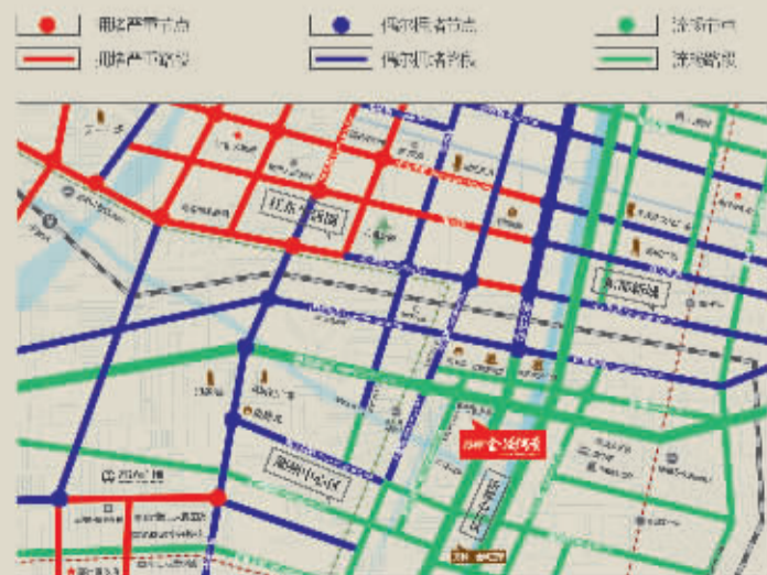
注：以上数据来源于百度地图。

以17:00-18:00的交通情况为样本，红色代表拥堵，蓝色代表正常，绿色代表畅通。备注：即将开建的地铁通道，将免遭堵车、红绿灯等烦恼，故不计入。