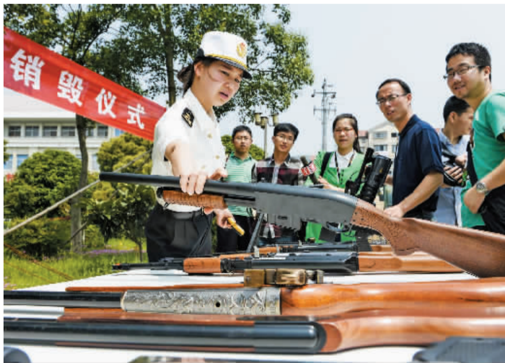
图为即将销毁的仿真枪。